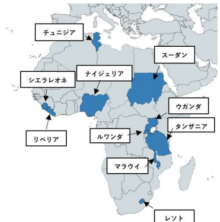
アフリカ地域における契約実績国