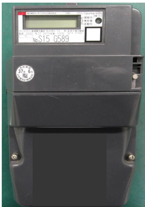
故障が発生したスマートメーターの外観 (外観上の異常は見られない)