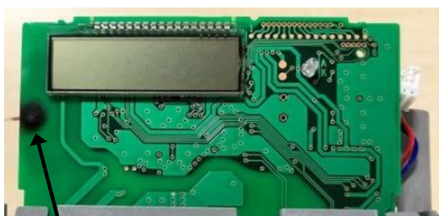
直径:約 7mm 正面側