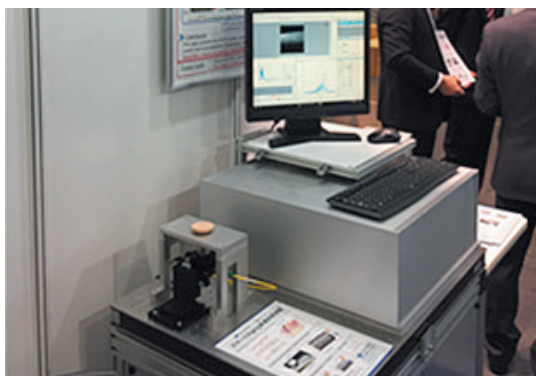
展示物（スマート Aging 皮膚診断装置）